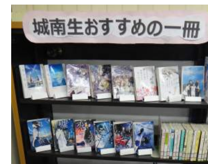
城南生おすすめの1冊

必要とする本が探しやすくなっていたり、月ごとにテーマを決めて本を展示していたりと、利用するみなさんの使いやすさを考えて図書を配置しています。