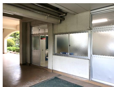
就職指導室（第2教棟1F）