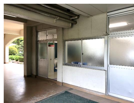
就職指導室（第2教棟1F）